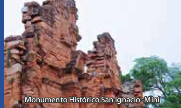
Monumento Histórico San Ignacio - Miní

De las reducciones quedaron las riquezas arqueológicas, la escultura, el trazado de las ciudades, la historia contada en museos, centros de cultura y universidades, misterios presentes que conforman el Circuito Internacional de las Misiones Jesuíticas.