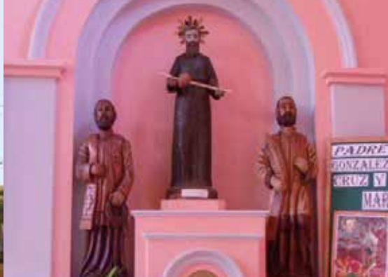
Imagen de los Tres Mártires: San Roque González, San Juan del Castillo, San Alonso Rodríguez.

Se trata de una iglesia con fachada de inspiración neo románica, simplificada, hecho que se manifiesta en su alta torre. Tiene una sola nave con nichos laterales, que data del año 1889. Fue construida en dos etapas con un estilo bizantino latino, y sus bases están asentadas sobre piedras de las ruinas jesuíticas. En el patio hay una antigua capilla donde se encuentra la réplica en madera de San Roque González.