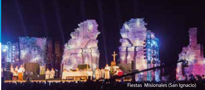
Fiestas Misionales (San Ignacio)