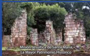
Misión Jesuítica de Santa María, La Mayor Patrimonio Histórico