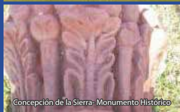
Concepción de la Sierra- Monumento Histórico