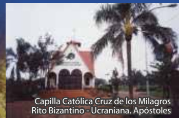
Capilla Católica Cruz de los Milagros Rito Bizantino -Ucraniana. Apóstoles