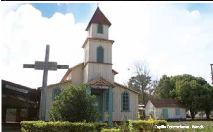
Capilla Czestochowa - Wanda

La diversidad religiosa honra a la Argentina y a Misiones en particular. Los primeros inmigrantes llegaron a la provincia en la primera mitad del siglo pasado y le dieron un inconfundible sello universalista y plural. Buscaban un horizonte de oportunidades, de sosiego y de respeto donde forjarse un futuro nuevo y aquí lo encontraron. Venían con sus tradiciones, su lengua y sobre todo, su fe. Del clima de paz y libertad propicio para un pleno desarrollo social y espiritual que aquí lo esperaba, hay sobrados testimonios en la provincia presente, uno de ellos es la pluralidad de credos. A este contexto, se suma el peso histórico de las Misiones Jesuítico de Guaraní, una experiencia social cultural y religiosa única en su tipo.