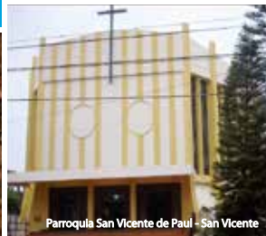
Parroquia San Vicente de Paul - San Vicente