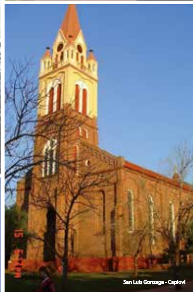
San Luis Gonzaga - Caploví