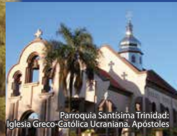
Parroquia Santísima Trinidad: Iglesia Greco-Católica Ucraniana. Apóstoles