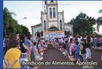
Bendición de Alimentos. Apóstoles

El ecumenismo alcanza su máxima expresión en el Parque de las Naciones de Oberá, donde durante todo el año se realizan eventos y se ofrecen comidas típicas en casas ambientadas con la particularidad de cada país de origen donde se podrá disfrutar de un “espectáculo”.