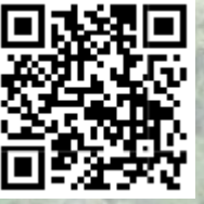
AVISTAJE DE AVES