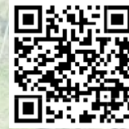
SENDERO EN DECK