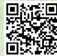
SENDERO AL MIRADOR DEL ARROYO