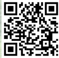
MIRADORES, BALCONES Y TERRAZAS