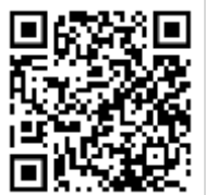
Alojamientos Salto Encantado, Aristóbulo del Valle