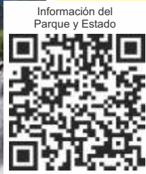
Información del Parque y Estado