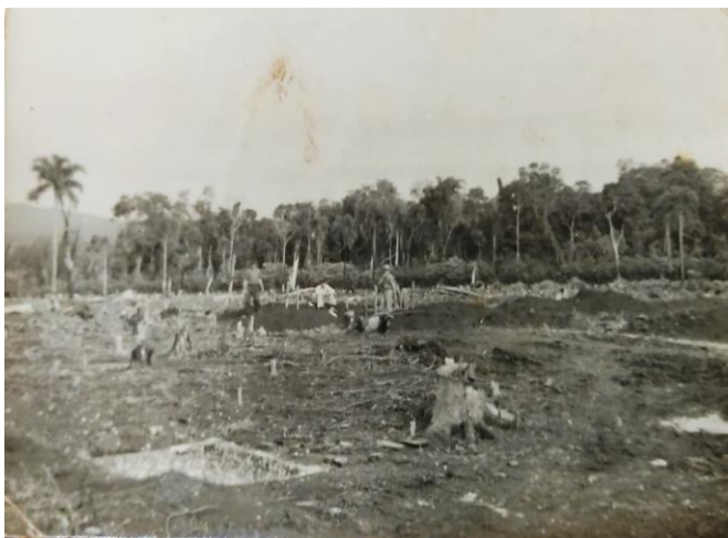
Preparación del terreno para la construcción del nuevo edificio