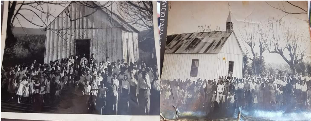
Edificio antiguo en día de misa