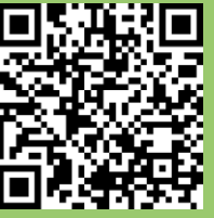
Parque Nacional Iguazú