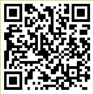
Cataratas del Iguazú